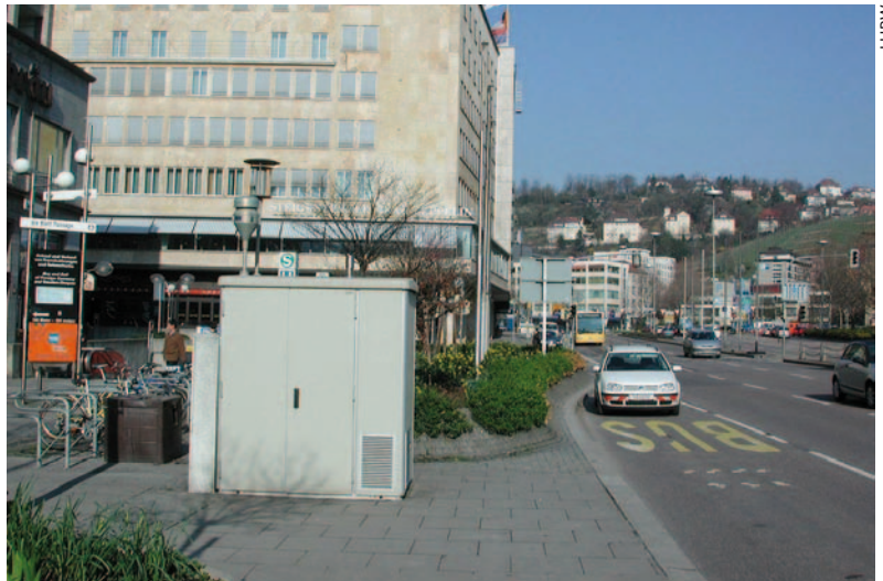
In diesem unscheinbaren Container in Stuttgart-Mitte verbergen sich die Ge-

Zunächst gilt es aber, die Schadstoffkonzentrationen zu messen, und das ist in der EU einheitlich geregelt. In Deutschland teilen sich Bund und Länder die Arbeit: Der Bund verantwortet die Hintergrundmessungen, die möglichst fern von Schadstoffquellen stattfinden, um die Qualität der weiträumig herantransportierten Luftmassen zu ermitteln. Die Länder überwachen die Luftqualität in Ballungsräumen und ländlichen Regionen. Was dabei wo gemessen wird, legen die Landesbehörden aufgrund der Bevölkerungsdichte und der lokalen Verteilung der Schadstoffverursacher fest. Das erklärt, warum die einzelnen Messstationen nicht alle die gleichen Schadstoffe erfassen. Die meisten Stationen analysieren aber einen einheitlichen Grundstock an gas-