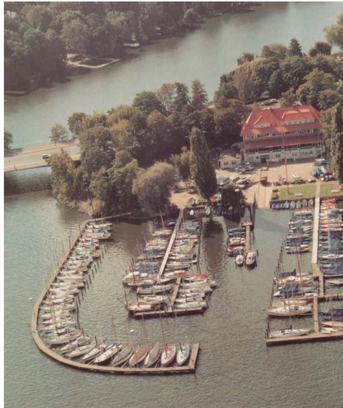
Die Clubanlage 1991