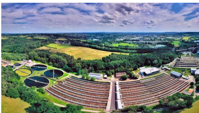
Bild 3: Die Kläranlage Aachen-Soers des Wasserverbandes Eifel-Rur (WVER) verfügt über eine großtechnische Ozonungsanlage. Der WVER ist einer der Partner, mit denen das Fraunhofer ILT die neue Abwasser-Monitoring-Technologie entwickelt.