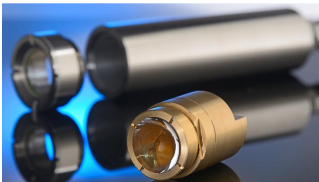
Bild 2: Im Rahmen des Programms REACT-EU führt das Projekt »FluoMonitor« Expertise aus Optik, Wasserwirtschaft und Analytik zusammen, um das Potenzial multidimensionaler Fluoreszenzsonden für die Inline-Flüssigkeitsanalyse zu evaluieren. Bei den Sonden kommt es auf hoch präzise Strahlführung an.