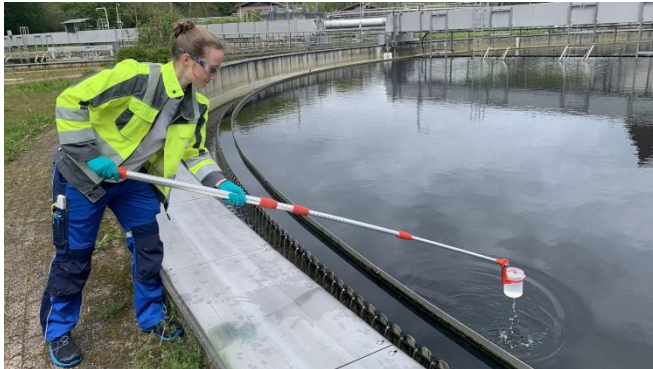
Bild 4: Das neue Inline-Messverfahren soll stichprobenartige manuelle Probenahmen wie hier in der Kläranlage Aachen Soers des Wasserverbandes Eifel-Rur ergänzen und in vielen Fällen ersetzen.