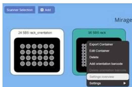
DP5 Network – typical multi-lab installation;

- DP5 Network kann von einem Laptop, Desktop, Telefon, Tablet oder einem anderen mit dem Netzwerk verbundenen Gerät ausgeführt werden. Diese leistungsstarke neue Software ermöglicht die vollständige Steuerung mehrerer Röhren-Barcodescanner im selben LAN, die von einem oder mehreren Geräten aus bedient werden können, die mit diesem LAN verbunden sind.